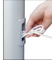
Nach dem Hissen Seil in Schlaufen legen und als Bund in das Bediengehäuse stecken.