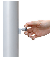
Entsperrstift ziehen, Riegel nach unten schieben: ENTSICHERN

FlagLift besteht aus dem Kompaktantrieb mit VA-Antriebsrad, dem VA-Hisseil und dem Langschlitten mit Federvorspannung. Alle Bauteile befinden sich in der Mastnut. Die Seil-arretierung wird durch eine Federbremse bewirkt, die durch einfaches Anheben des Sicherungsriegels das Antriebsrad blockiert und den Steckerzugang für die Handkurbel verschließt. Die Entriegelung erfolgt mittels eines Spezial-Entsperrstiftes in einem Handgriff.