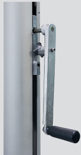
Kurbelhissvorrichtung FlagLift , Handkurbel