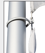
Den untersten Karabiner und das Fahnenstraffergewicht in das Fahnenstrafferband einhaken.