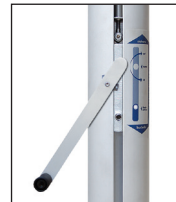
Kompaktantrieb, Handkurbel mit Entsperrstift