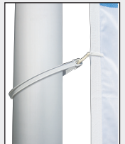
Die mittleren Karabiner in die FahnenSchlingen einhaken.