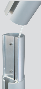
Steckstoß ZA75 2-teilig