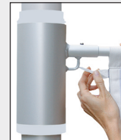
Fahne auf Auslegerrohr aufziehen und obersten Karabiner in Rotoröse einhaken.