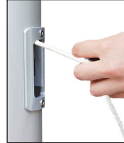
Hissen der Fahne durch horizontales Ziehen, Einholen durch Loslassen.

klassische Innenseilführung mit dem im Mastrohr laufenden PES-Hisseil. Die Handhabung des Hisseiles erfolgt über das Bediengehäuse mit (SchnellFixierSystem) -SFS mit sperrbarem Türchen. Hissen und Abnehmen der Fahnen erfolgt durch Ziehen bzw. Nachlassen des Hisseiles. Bei Loslassen arretiert das Hisseil selbsttätig in der Spezial-Seilklemme im SFS-Gehäuse.