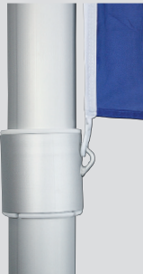
Zubehör: Fahnenstraffer, unverlierbar