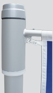
Mastkappe mit Rotor, Teleskopausleger